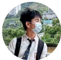
保良局羅傑承（一九八三） 中學中六甲班