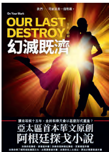
金鈴、森焱著《幻滅既濟》，二〇二二年，天地圖書出版。（資料圖片）

近年的作品，包括有阿根廷作家托瑪斯·埃羅伊·馬汀茲於二〇〇四年出版的作品《探戈歌手》；西班牙熱銷三十萬冊的《老派探戈》，完美結合文學內涵、閱讀娛樂和藝術；國際曼布克文學獎得主卡勒斯納霍凱·拉斯洛的《撒旦的探戈》；科爾姆·托賓筆下的《關於伊麗莎白·畢肖普》。另有不少文學小說，都夾雜一小部分探戈作為內容。然而，全本以阿根廷探戈為主軸，以華文撰寫的小說，大概只有剛剛