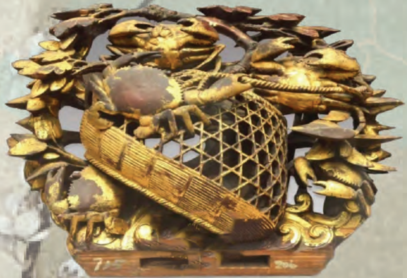
潮州清代木雕蟹簍梁托