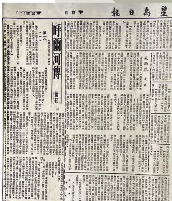
蕭紅經典作品《呼蘭河傳》，一九四〇年九月一日起在《星島日報》副刊連載。

一九四二年，蕭紅在香港走完她短暫人生的最後旅程，在顛沛流離最後兩年，她先後在香港報章和雜誌發表了多部作品，包括《呼蘭河傳》、《馬伯樂》、《小城三月》等。香江有幸承載過蕭紅的骨灰和她的傳世篇章。 一九四〇年一月十七日蕭紅和端木蕻良從重慶抵港，先後在尖沙咀諾士佛臺和樂道居住，兩人安頓後便投入寫作。四月，蕭紅完成短篇小說《後花園》，交給香港《大公報》連載。戴望舒得到蕭紅同意，把《呼蘭河傳》拿到《星島日報》刊登，九月一日起在《星島》副刊《星座》連載，十二月二十七日，被譽