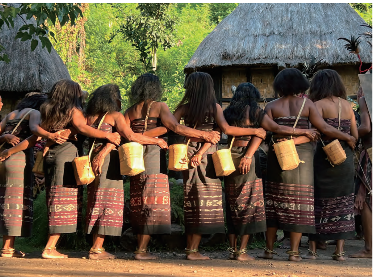
二〇二二年五月攝於印尼峇里島

她們的背簍裏是什麼 是好吃的嗎 當然不是啦 她們的背簍裏是快樂 她們要把快樂背在身上 因為她們知道 快樂是選擇 不是追求