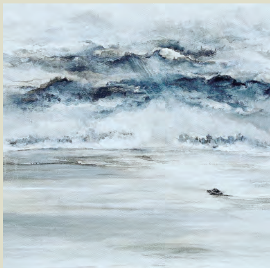
風把一些事物吹往冬天／十月的陽光被淡泊暗傷。照着空無 （潘宇清繪畫）