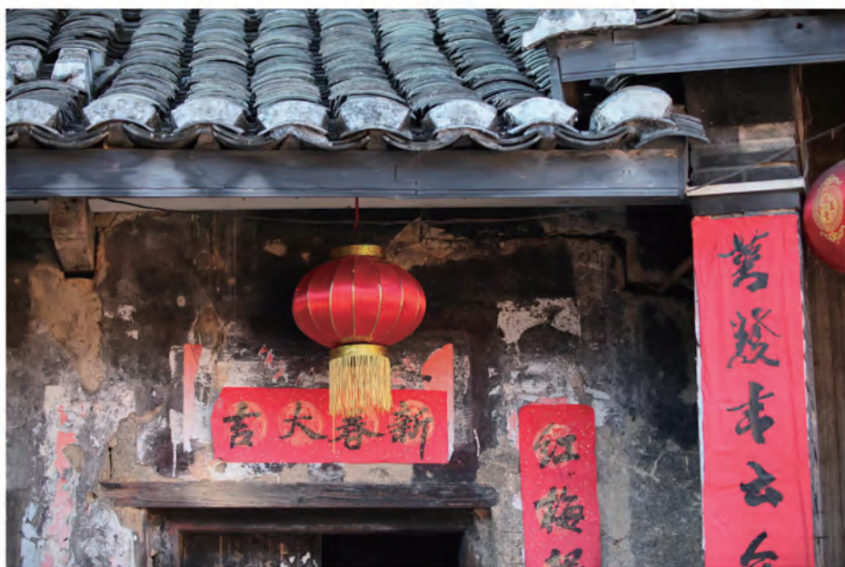
《梅州古屋》