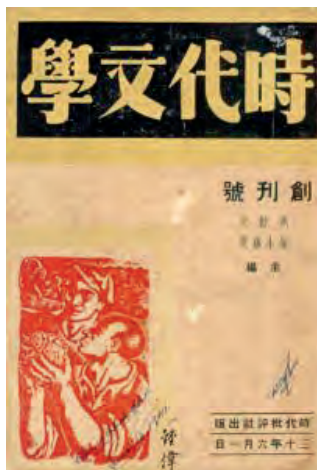
蕭紅小說《馬伯樂》，一九四一年二月起在《時代批評》雜誌連載；小說《小城三月》刊於《時代文學》第二期。