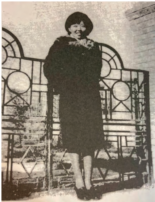
蕭紅一九四〇年攝於香港。

沉着應對戰亂環境，專心寫作，結果她戰勝了逆境，完成一部又一部名著。可惜，她卻無法戰勝病魔。 蕭紅到香港主要是找一個清靜地方專心寫作和養病，但身體日差，她可能自知時日無多，因此拼盡最後心血寫下傳世名篇。蕭紅後來確診患上肺結核，部分患處已鈣化，她幾次進出瑪麗醫院，最後一次是不理勸告堅持出院。一九四一年十二月日軍壓境，蕭紅身體已非常虛弱，但仍要不時轉換養病地點，一九四二年一月二十二日，蕭紅在聖士提反女校臨時救護站棄世，只得三十歲。一月二十五日，端木蕻良和駱賓基把蕭紅一半骨灰埋放在淺水灣，一九五七年再遷葬廣州。 （作者為資深傳媒人。）